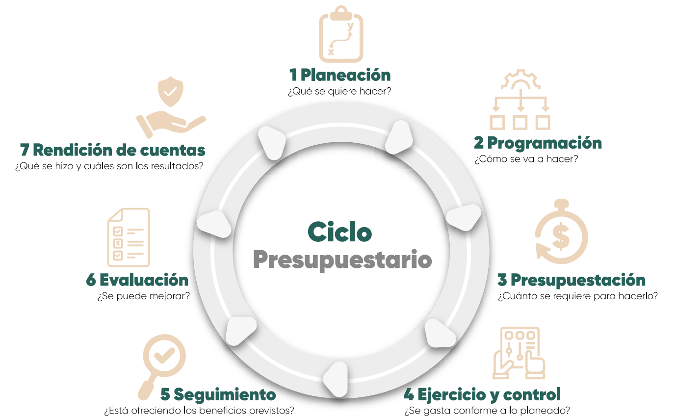
Esquema 3. Etapas del ciclo presupuestario