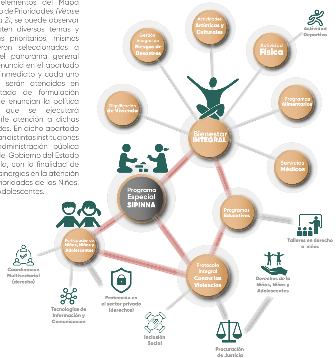
Esquema 2. Mapa Sistémico de Prioridades del Programa Especial de las Niñas, Niños y Adolescentes