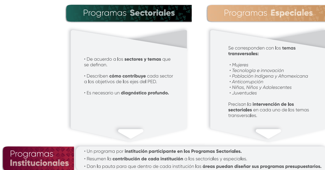
Esquema 1. Estructura de los Programas Institucionales

En el contexto de la planeación táctica del Gobierno del Estado de Puebla para el periodo 2024–2030, los programas institucionales están estructurados a partir de un marco estratégico que incluye: misión, visión, valores, ámbito funcional y componentes estratégicos. Estos componentes definen la participación de las instituciones en los Programas Sectoriales y Programas Especiales , (Véase Esquema 1), los cuales son instrumentos clave para la implementación de las políticas públicas estatales. Dichos programas están alineados con el Plan Estatal de Desarrollo del Gobierno del Estado de Puebla 2024–2030 (PED), y tienen como propósito orientar la acción gubernamental mediante objetivos, estrategias, líneas de acción e indicadores y metas medibles, enfocados en atender las necesidades prioritarias de la población.