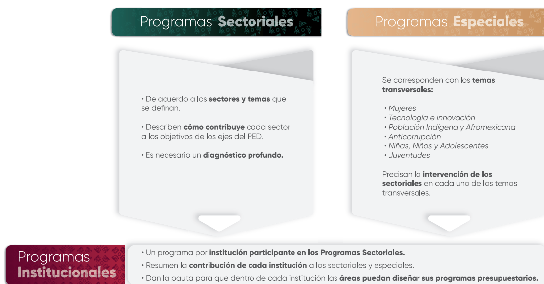
Esquema 1. Estructura de los Programas Institucionales

En el contexto de la planeación táctica del Gobierno del Estado de Puebla para el periodo 2024-2030, los programas institucionales están estructurados a partir de un marco estratégico que incluye: misión, visión, valores, ámbito funcional y componentes estratégicos. Estos componentes definen la participación de las instituciones en los Programas Sectoriales y Programas Especiales , (Véase Esquema 1 ), los cuales son instrumentos clave para la implementación de las políticas públicas estatales. Dichos programas están alineados con el Plan Estatal de Desarrollo del Gobierno del Estado de Puebla 2024-2030 (PED), y tienen como propósito orientar la acción gubernamental mediante objetivos, estrategias, líneas de acción e indicadores y metas medibles, enfocados en atender las necesidades prioritarias de la población.