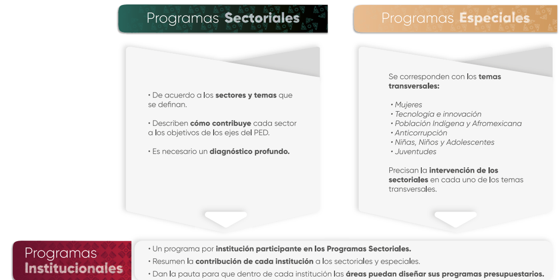
Esquema 1. Estructura de los Programas Institucionales

En el contexto de la planeación táctica del Gobierno del Estado de Puebla para el periodo 2024-2030, los programas institucionales están estructurados a partir de un marco estratégico que incluye: misión, visión, valores, ámbito funcional y componentes estratégicos. Estos componentes definen la participación de las instituciones en los Programas Sectoriales y Programas Especiales , (Véase Esquema 1 ), los cuales son instrumentos clave para la implementación de las políticas públicas estatales. Dichos programas están alineados con el Plan Estatal de Desarrollo del Gobierno del Estado de Puebla 2024-2030 (PED), y tienen como propósito orientar la acción gubernamental mediante objetivos, estrategias, líneas de acción e indicadores y metas medibles, enfocados en atender las necesidades prioritarias de la población.