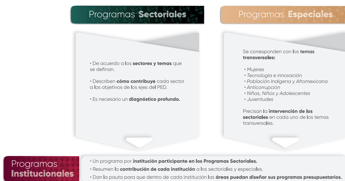
Esquema 1. Estructura de los Programas Institucionales

En el contexto de la planeación táctica del Gobierno del Estado de Puebla para el periodo 2024–2030, los programas institucionales están estructurados a partir de un marco estratégico que incluye: misión, visión, valores, ámbito funcional y componentes estratégicos. Estos componentes definen la participación de las instituciones en los Programas Sectoriales y Programas Especiales , (Véase Esquema 1), los cuales son instrumentos clave para la implementación de las políticas públicas estatales. Dichos programas están alineados con el Plan Estatal de Desarrollo del Gobierno del Estado de Puebla 2024–2030 (PED), y tienen como propósito orientar la acción gubernamental mediante objetivos, estrategias, líneas de acción e indicadores y metas medibles, enfocados en atender las necesidades prioritarias de la población.