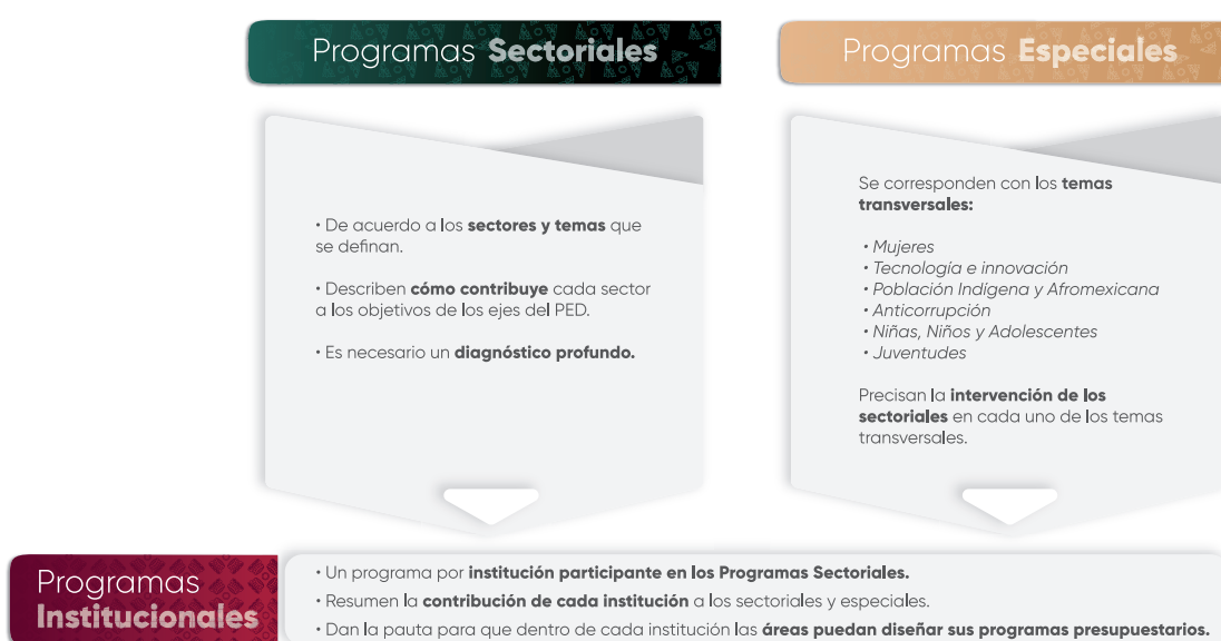
Esquema 1. Estructura de los Programas Institucionales

En el contexto de la planeación táctica del Gobierno del Estado de Puebla para el periodo 2024–2030, los programas institucionales están estructurados a partir de un marco estratégico que incluye: misión, visión, valores, ámbito funcional y componentes estratégicos. Estos componentes definen la participación de las instituciones en los Programas Sectoriales y Programas Especiales , (Véase Esquema 1 ), los cuales son instrumentos clave para la implementación de las políticas públicas estatales. Dichos programas están alineados con el Plan Estatal de Desarrollo del Gobierno del Estado de Puebla 2024–2030 (PED), y tienen como propósito orientar la acción gubernamental mediante objetivos, estrategias, líneas de acción e indicadores y metas medibles, enfocados en atender las necesidades prioritarias de la población.