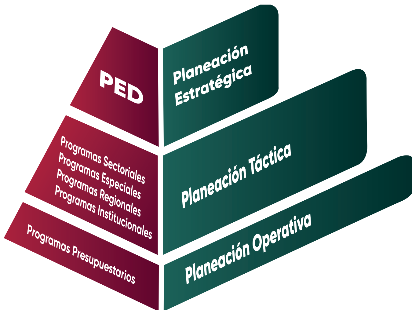
Esquema 1. Niveles de planeación