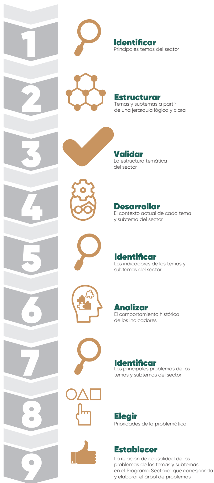
Esquema 1. Metodología para la elaboración de los Programas Sectoriales

A continuación, se describen las 9 etapas metodológicas que guían el proceso de construcción del programa.